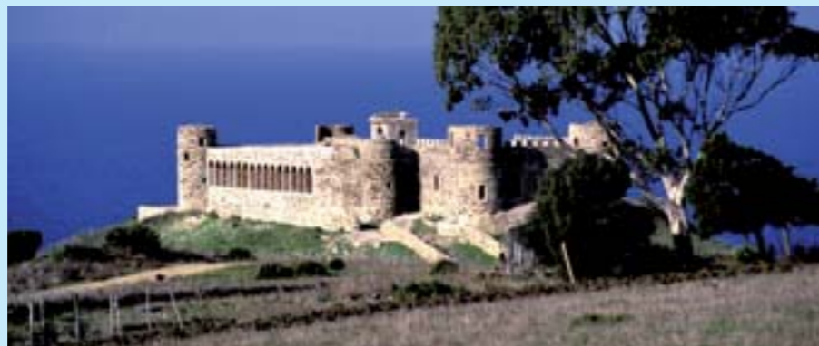
Le château fort de Malabata

Principale porte maritime du Royaume vers la Méditerranée, le port de Tanger occupe une position stratégique entre l'Atlantique et la Méditerranée. Premier port national pour les passagers, le port de Tanger regroupe les activités de commerce, de pêche et de plaisance. Les nombreuses navettes à passagers avec l'Europe, les gros vraquiers, les chalutiers, les barques de pêche et les petits voiliers utilisent le même chenal d'entrée.