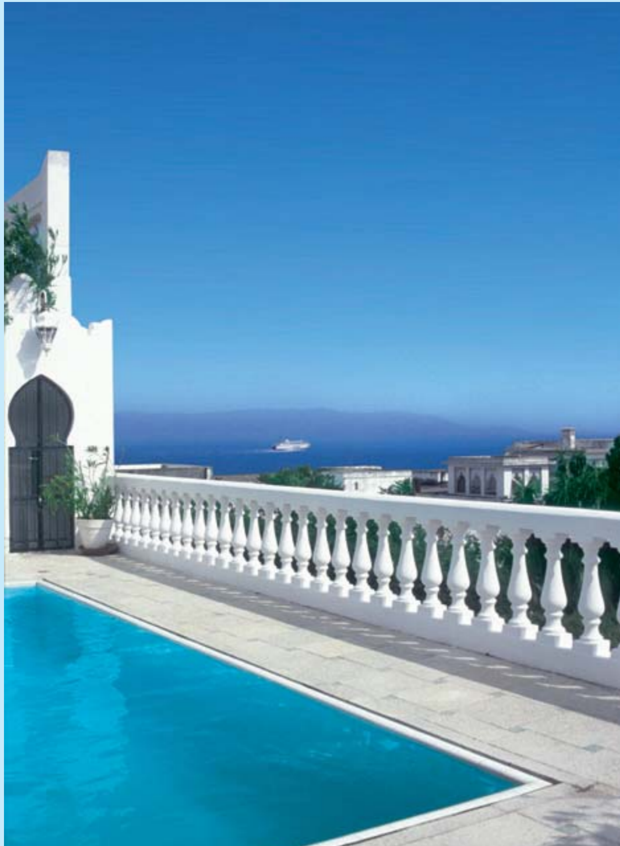
La casbah de Tanger