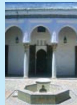
Musée archéologique de la casbah

C'est aussi à Tanger, dans le parc de la Mendoubia, que le Roi Mohammed V prononce en 1947 le discours par lequel il réclame l'indépendance du Maroc. Tanger gardera son statut particulier jusqu'en 1960. Aujourd'hui, la ville a conservé son côté cosmopolite. Les différentes influences ont façonné à la fois sa diversité culturelle et sa forte personnalité. Un nouveau souffle