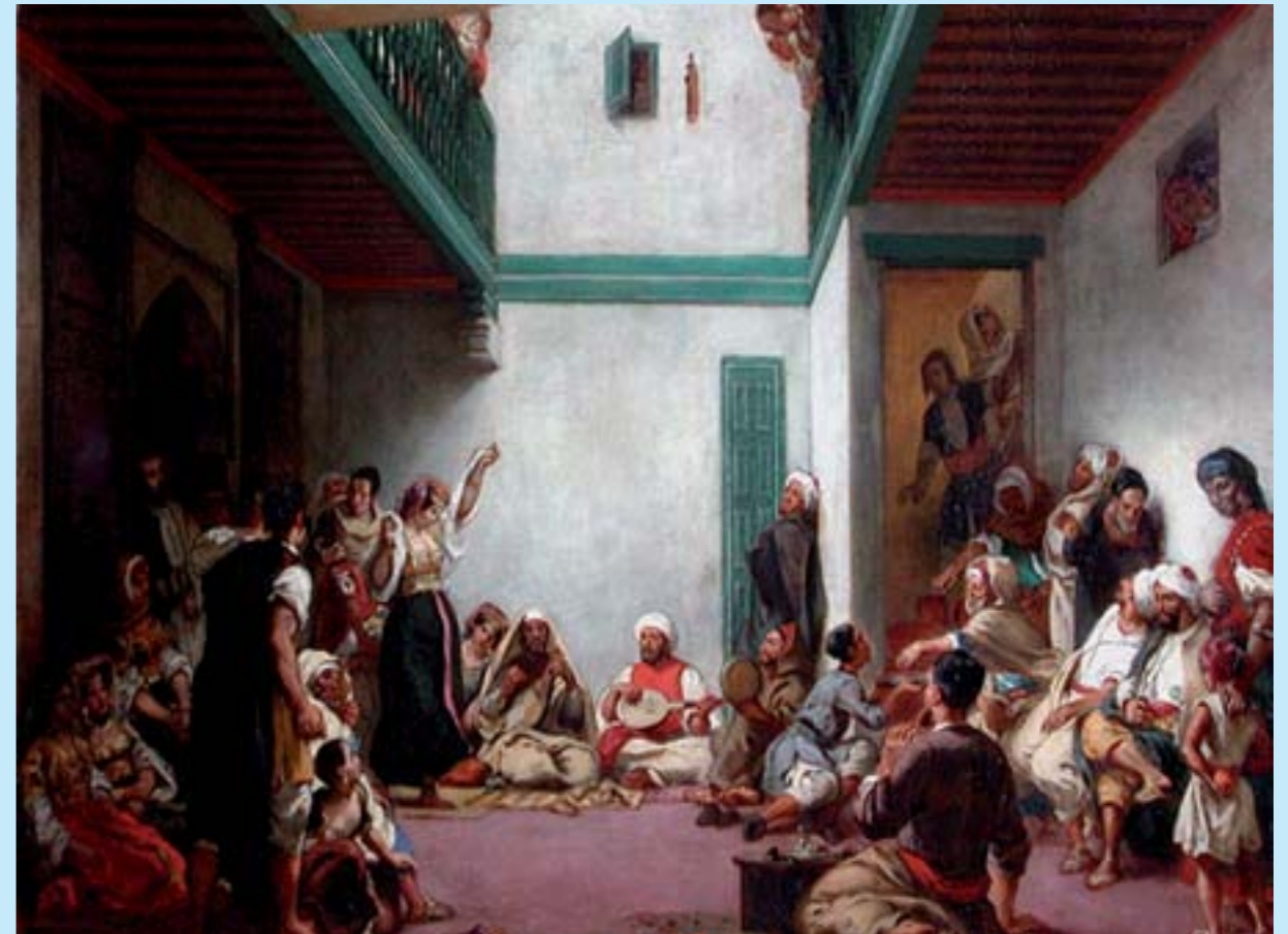
Les noces juives par Eugène Delacroix