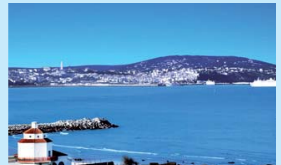
La baie de Tanger

La ville en a séduit plus d'un, et non des moindres ! Les multiples visages de Tanger font rêver depuis des siècles artistes et intellectuels, conquérants et beatniks, milliardaires et excentriques. Son histoire est celle de la cité qui a inventé la mondialisation. Tanger est avant tout une ambiance. Quand on la quitte, on se demande si on ne l'a pas rêvée.