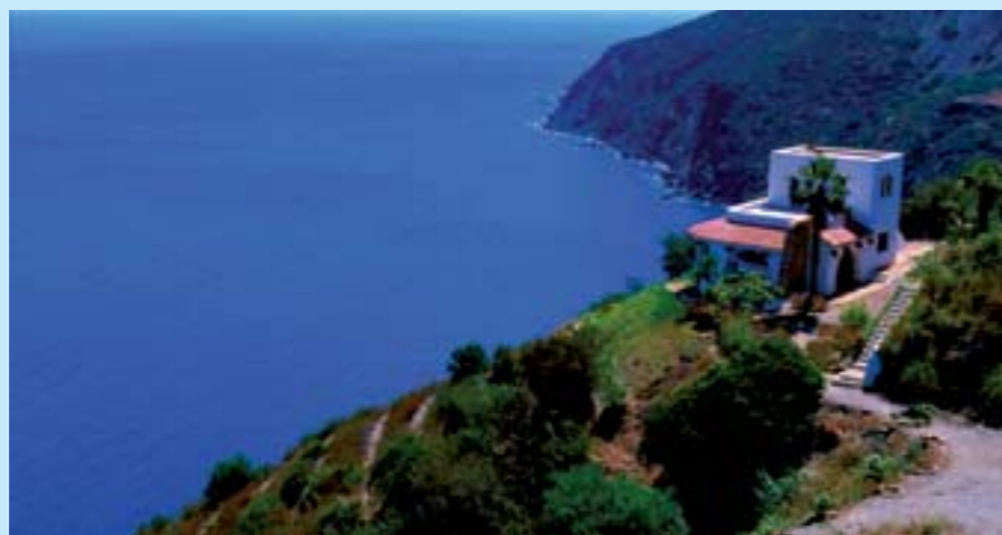
Les criques de la côte méditerranéenne

Situées sur la rive droite à l'embouchure de la rivière «Ksar Sghir», la ville se trouve sur le littoral méditerranéen. Son existence remonte à environ un siècle avant J.C. Les vestiges d'une usine de salaison permettent de fixer à cette époque la toute première occupation du site. Ksar Sghir fut conquis en 1458 par les Portugais qui ne le quittèrent qu'au début du XVIIème siècle à la grande joie des arabes expulsés de l'Andalousie, qui vinrent alors s'y installer. Aujourd'hui, ce qui fait son charme et son intérêt aux yeux de bon nombre de touristes, ce sont son architecture d'antan et ses belles criques alentours.