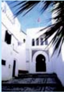
Ruelle dans la casbah

Après une présence phénicienne, attestée par quelques vestiges dont deux nécropoles, la ville est fondée au IV e siècle avant J.C. par les Carthaginois qui en font un comptoir : Tingi. En 146 avant J.C., à la chute de Carthage, la ville est rattachée sous le nom de Tingis au royaume de Maurétanie, allié de Rome et gouverné par Juba II. Sous l'empereur Claude, la Maurétanie devient colonie romaine : la Maurétanie Tingitane, avec Tingis pour capitale. En 706 ap. J.C, lors de la conquête arabe, la ville est prise par le général Omeyyade Moussa Ibn Noussair. C'est de là que les troupes de Tarik Ibn Ziad partent conquérir l'Espagne en 711.