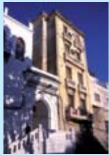
Entrée de la médina

A l'entrée de la Médina, le grand Socco (souk en espagnol) est le lieu le plus fréquenté de la ville. La place est bordée par l'ancienne résidence du Mendoub (représentant du Sultan) et son parc. Le parc de la Mendoubia est une splendeur avec son figuier banyan géant et ses nombreux dragonniers centenaires.