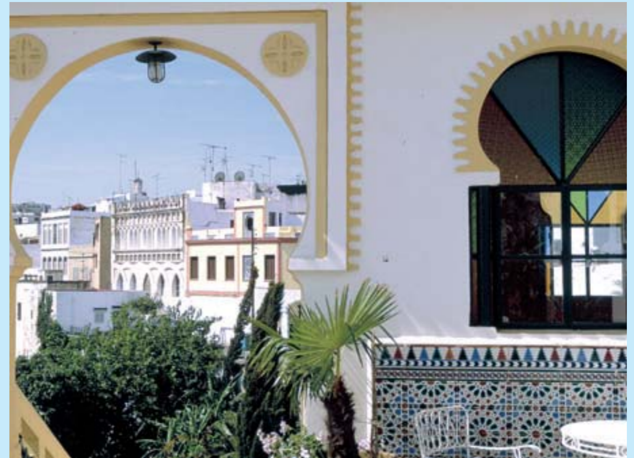
Vue sur la médina de Tanger

Dès le XIX e siècle, les nations européennes multiplient missions diplomatiques et commerciales à Tanger. En 1906, la conférence d'Algésiras prévoit un statut spécial pour la ville qui devient en 1925 zone franche internationale sous la souveraineté du Sultan du Maroc. L'époque du «statut international» est la période dorée de Tanger : celle de son grand rayonnement culturel et économique, celle de la réputation «romanesque» de Tanger dans le cinéma et la littérature.