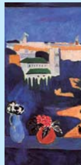
Tanger par Matisse

Librairie mythique de Tangier, «la librairie des Colonnes» reste ce lieu où doivent se croiser un jour ou l'autre les intellectuels tangérois pour se ressourcer. Certains n'en sont jamais partis : Jean Genet, Paul Bowles, Tennessee Williams Burrouw et Tennessee Williams... Alors, si vous passez par Tangier, poussez la porte de la librairie des Colonnes à la rencontre des passionnés de la ville.