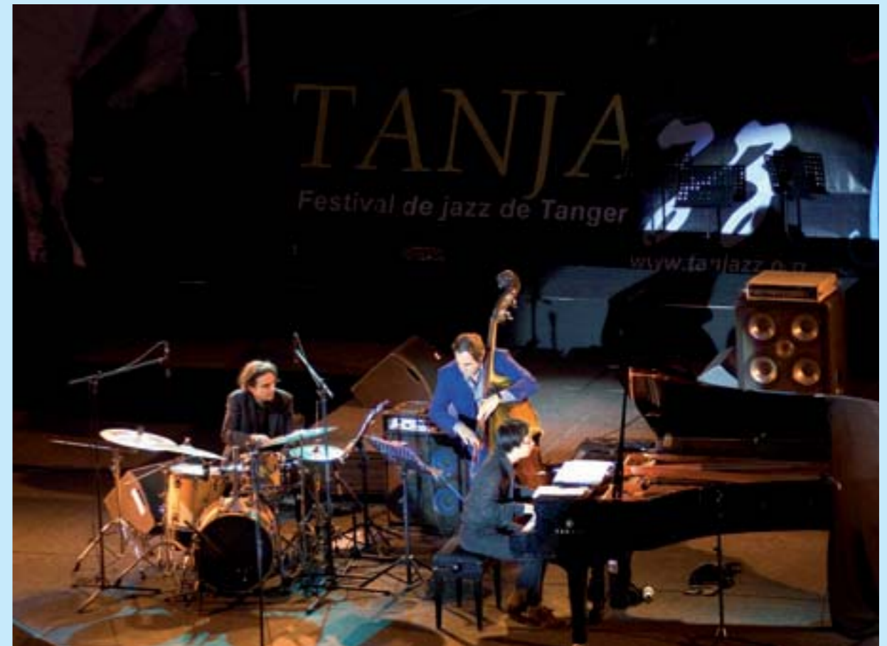
Le festival «Tanjazz»