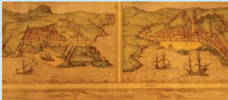
Croquis de Tingis au musée de la légation américaine

Dans les siècles qui suivent, Tanger devient l'enjeu des luttes entre Idrissides et Omayyades d'Espagne, puis Almoravides, Almohades et Mérinides. Un enjeu convoité