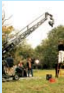
Film tourné à Tanger

Le festival «Les Nuits de la Méditerranée» offre au public tangérois un voyage artistique d'une semaine dans les méandres du patrimoine musical authentique et moderne en provenance des trois continents. C'est dans le parc de la Mendoubia, au cœur de la ville historique, que se déroulent «Les Nuits de la Méditerranée». Voilà l'endroit rêvé pour découvrir, en toute convivialité, de jeunes artistes en devenir et de grands noms à la présence rare dans les circuits balisés des musiques du monde.