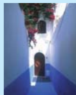
Ruelle à Asilah

«Festival Culturel International». Port stratégiquement placé, Asilah fut romaine, espagnole et portugaise. Bastions, tours et remparts farouches offrent aujourd'hui de belles promenades en bord de mer des restaurants réputés pour leur repas à base de poissons frais.