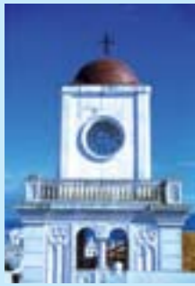
Clocher de l'église de Tangier