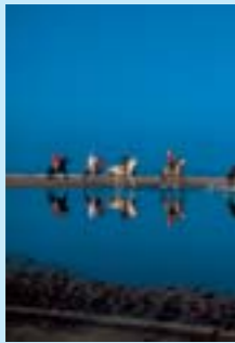
Les sports équestres en bord de mer