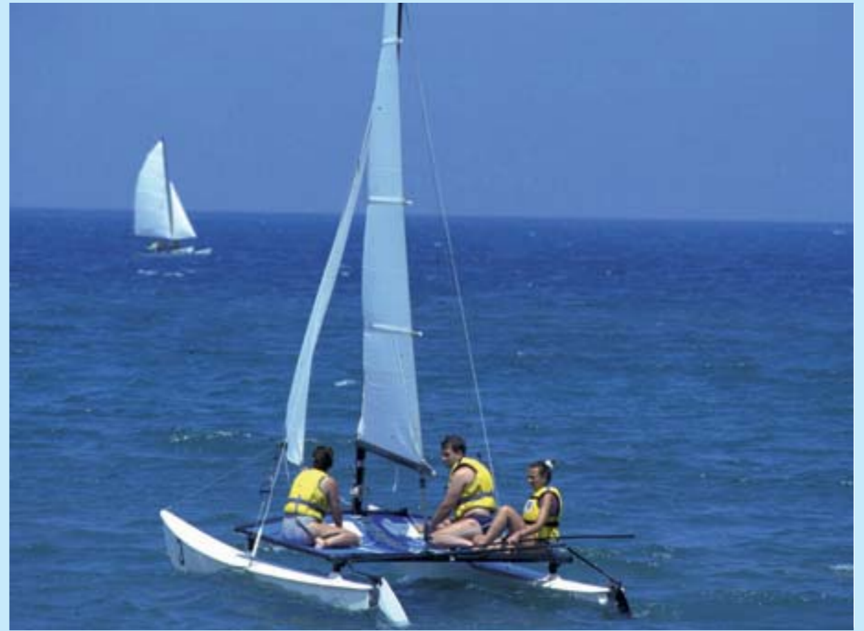
Les plages de Tanger sont propices à tous les sports nautiques