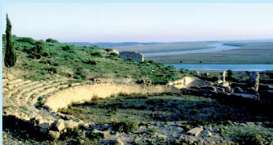
Le site archéologique de Lixus

Près de Larache se situent les ruines de Lixus, port carthaginois et romain, sur l'autre rive du fleuve Loukkos.