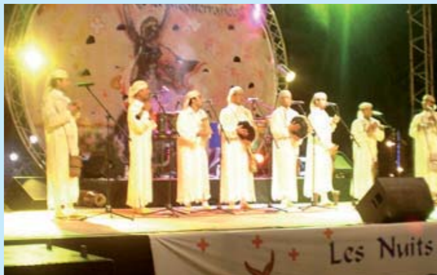
Le festival «Les Nuits de la Méditerranée»