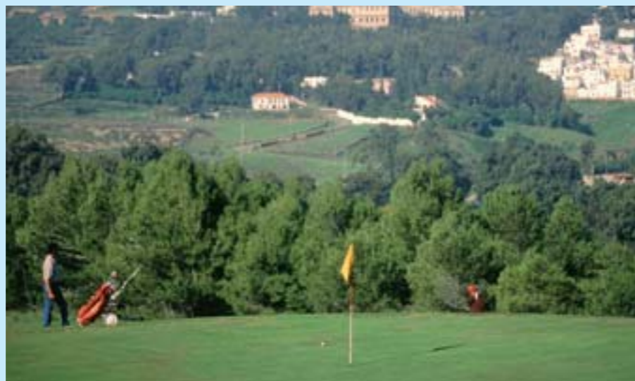
Le golf de Tanger

Fruit d'un lointain héritage anglais, Tanger peut s'enorgueillir de posséder un stade de cricket où des équipes internationales se confrontent.