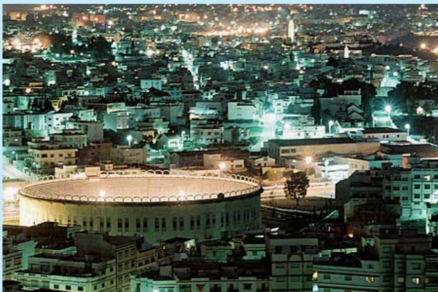
Plaza de Toros

La Kasbah, âme de Tanger, est l'ancienne forteresse avec ses remparts qui domine la médina et toute la ville. On y accède depuis le Grand Socco par la rue d'Italie en montant la rue de la Kasbah. Quartier d'anciens palais, elle recèle de superbes demeures. Place de la Kasbah, le Palais du sultan «Dar el Mekhzen» renferme un musée consacré aux arts marocains. Le palais voisin, Dar Chorfa, accueille le musée des antiquités et d'archéologie. Le café du Détroit est un lieu privilégié, il tient son nom de la vue magnifique que l'on a sur le détroit..