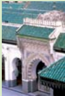
Mosquée Al Quaraouiyine Fès