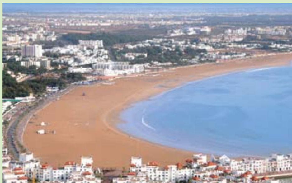
La baie d'Agadir

Agadir tend à devenir une cité incontournable du golf marocain proposant à ses joueurs, en plus du golf, de nombreuses attractions touristiques pour des séjours alliant découverte culturelle dans un arrière pays fabuleux, bien-être, avec le développement des centres de thalassothérapie et bien sûr, la découverte de la gastronomie marocaine. Entre montagne et océan, avec ses 360 jours de soleil par an, une température toujours douce et une baie de 10 kilomètres de plages sublimes, Agadir dispose d'atouts uniques pour un séjour golfique. Aux quatre splendides golfs, aux fairways emplis d'un bouquet de senteurs composées d'eucalyptus, de genêts et de mimosas, viendront s'ajouter prochainement deux nouveaux parcours le golf de Taghazout et le Golf Beach.