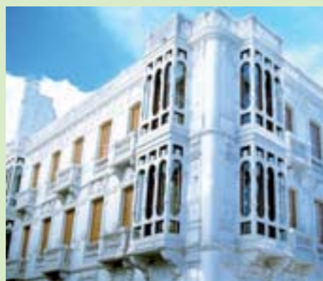
Bibliothèque Cervantes – Tétouan

Quant à Saïdia, sa proximité de la vallée de Zegzel, véritable site naturel, et de la médina d'Oujda, mémoire vivante de l'Oriental, ou encore de l'oasis de Figuig, constitue des atouts majeurs qui font de la station un lieu d'exception.