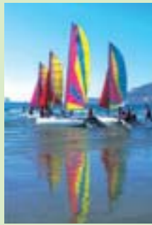
Les sports nautiques à Agadir

Agadir tend à devenir une cité incontournable du golf marocain proposant à ses joueurs, en plus du golf, de nombreuses attractions touristiques pour des séjours alliant découverte culturelle dans un arrière pays fabuleux, bien-être, avec le développement des centres de thalassothérapie et bien sûr, la découverte de la gastronomie marocaine. Entre montagne et océan, avec ses 360 jours de soleil par an, une température toujours douce et une baie de 10 kilomètres de plages sublimes, Agadir dispose d'atouts uniques pour un séjour golfique. Aux quatre splendides golfs, aux fairways emplis d'un bouquet de senteurs composées d'eucalyptus, de genêts et de mimosas, viendront s'ajouter prochainement deux nouveaux parcours le golf de Taghazout et le Golf Beach.