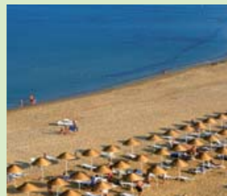
Plage de Tamuda Bay