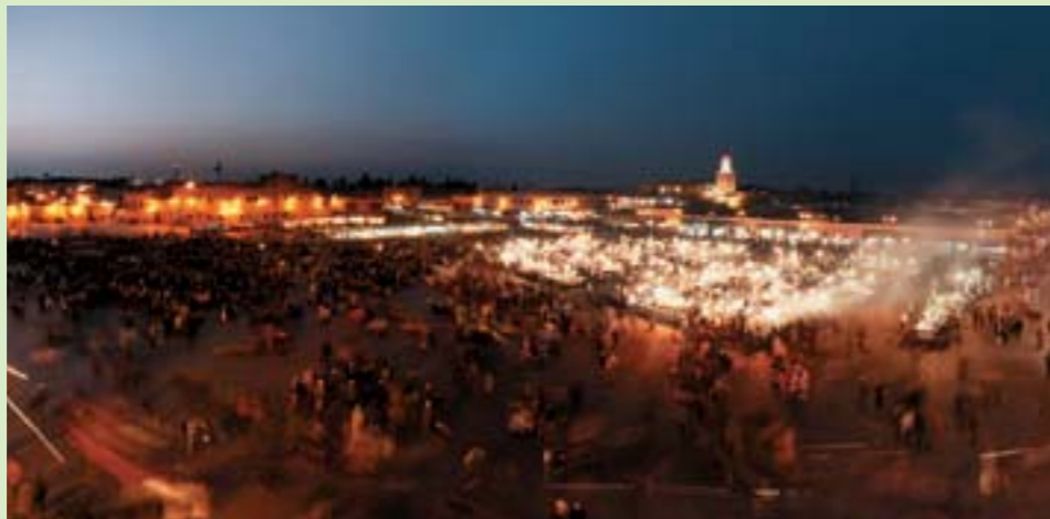
Place Jemaa El Fna - Marrakech

Marrakech est la cité du golf par excellence. Siège depuis 2006 de la David Leadbetter Golf Academy, l'une des meilleures académies au monde, le Royal Golf de Marrakech, construit en 1923, est le deuxième plus ancien golf du Maroc. Ses greens ont été foulés par d'éminentes personnalités, tels Churchill ou Eisenhower... Depuis, la ville de Marrakech a élargi son périmètre golfique : quatre golfs encadrent la ville, aux pieds des montagnes enneigées de l'Atlas, où l'on peut profiter du grand air après une journée de soleil. Il sera encore temps, après des heures passées sur un des parcours, de suivre celui plus culturel qu'offre Marrakech à ses visiteurs. De la place Jemaa-el-Fna, point névralgique de Marrakech, Patrimoine Oral de l'Humanité, centre festif et chaleureux, en passant par la visite des jardins (les jardins de la Ménara, le jardin Majorelle pour les plus connus), on se perdra avec bonheur dans le dédale des allées de la médina animée.