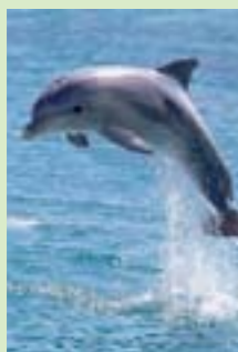
Réserve naturelle de la région de Saïdia

Au nord du Maroc, au point de rencontre de la mer méditerranée et de l'océan atlantique se trouvent trois terrains singuliers qui constituent l'expérience méditerranéenne. Ces golfs sont très fréquentés par les joueurs européens, en été comme en hiver.