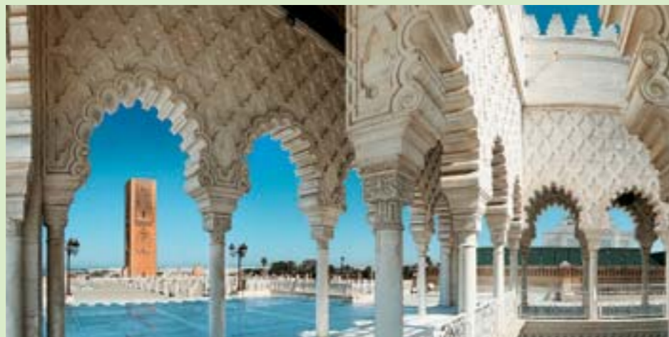
Mausolée Mohammed V – Rabat

Tout au long de ce voyage historique et de cette expérience de la culture, les golfeurs trouveront dix golfs, tous dressés autour des cités marocaines.